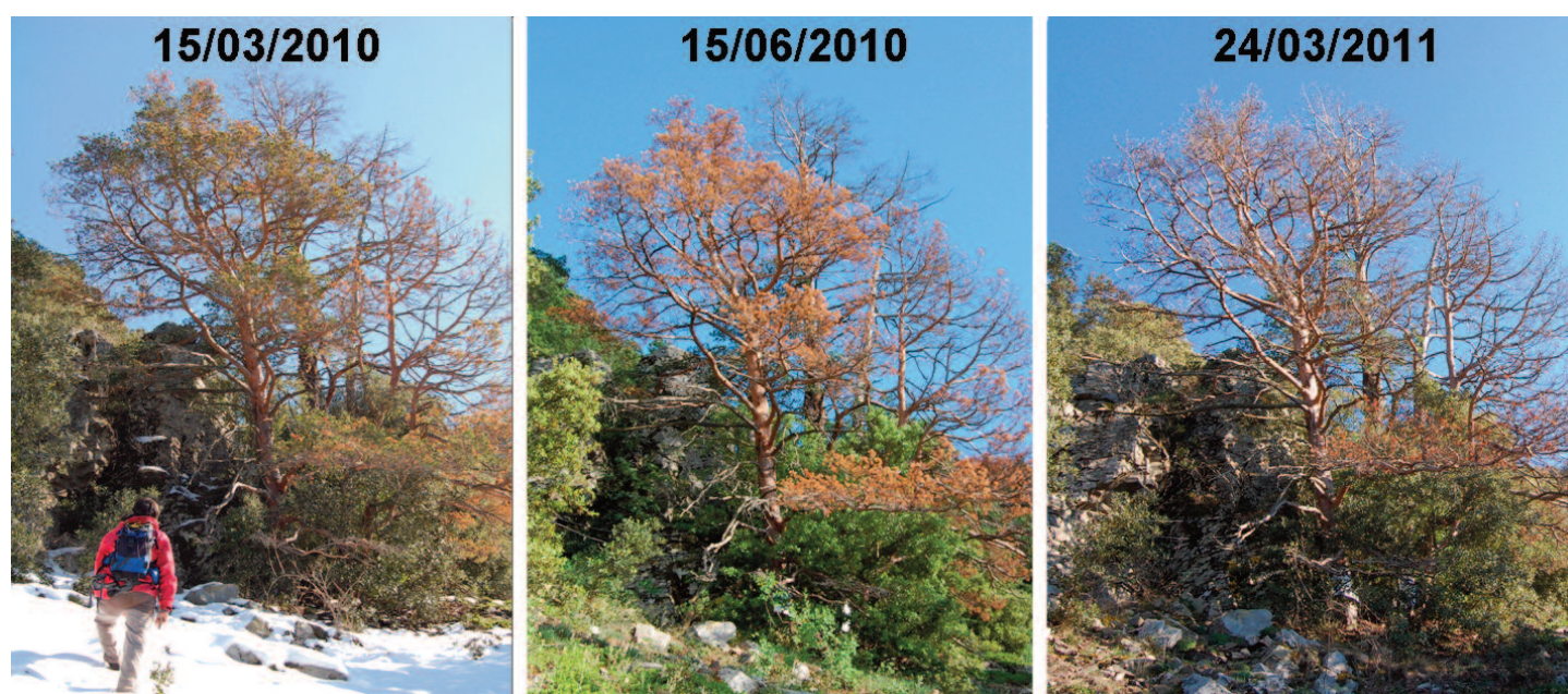
Figura 2. Secuencia de fotografías de un pino albar muriendo en las montañas de Prades (Tarragona).

Es importante considerar también que la respuesta del crecimiento al clima depende de la edad de los pinos. Bogino et al. (2009) encontraron que las variables climáticas explicaban una mayor proporción de la variabilidad en el crecimiento en los pinares jóvenes. En otro estudio reciente, mostramos que los árboles de mayor edad presentan una menor resiliencia ante un episodio de sequía extrema (Martínez-Vilalta et al. 2012). En este mismo trabajo se constata también que los individuos de crecimiento más rápido se ven proporcionalmente más afectados por la sequía y, aunque su velocidad de recuperación es también mayor, tardan más tiempo en recuperar las tasas de crecimiento previas al episodio. Los efectos de las características de la parcela fueron menores que los de los atributos individuales y, en general, indicaron que la elevada competencia por los recursos empeora los efectos de la sequía en el crecimiento del pino albar (Martínez-Vilalta et al. 2012).